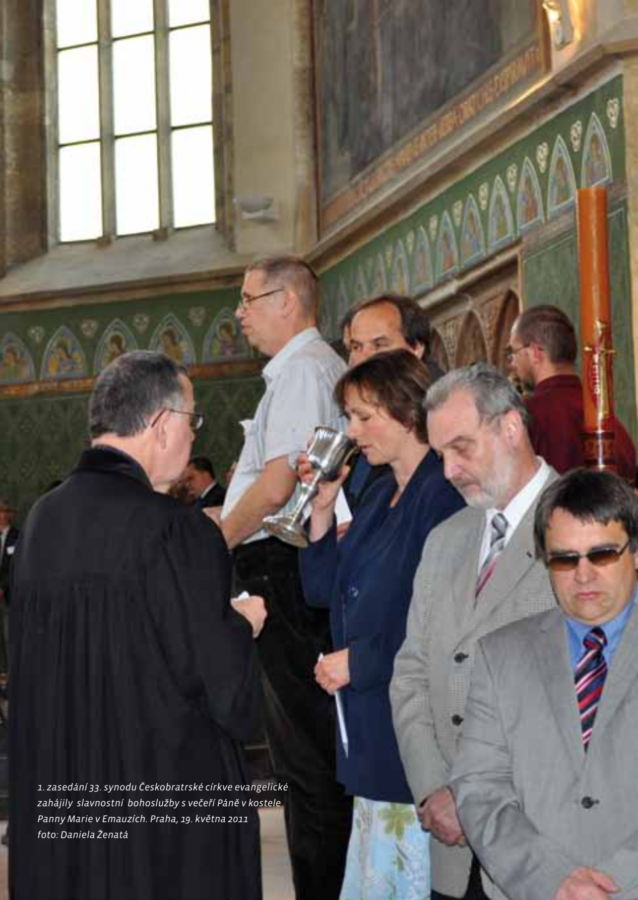
1. zasedání 33. synodu Českobratrské církve evangelické zahájily slavnostní bohoslužby s večeří Páně v kostele Panny Marie v Emauzích. Praha, 19. května 2011