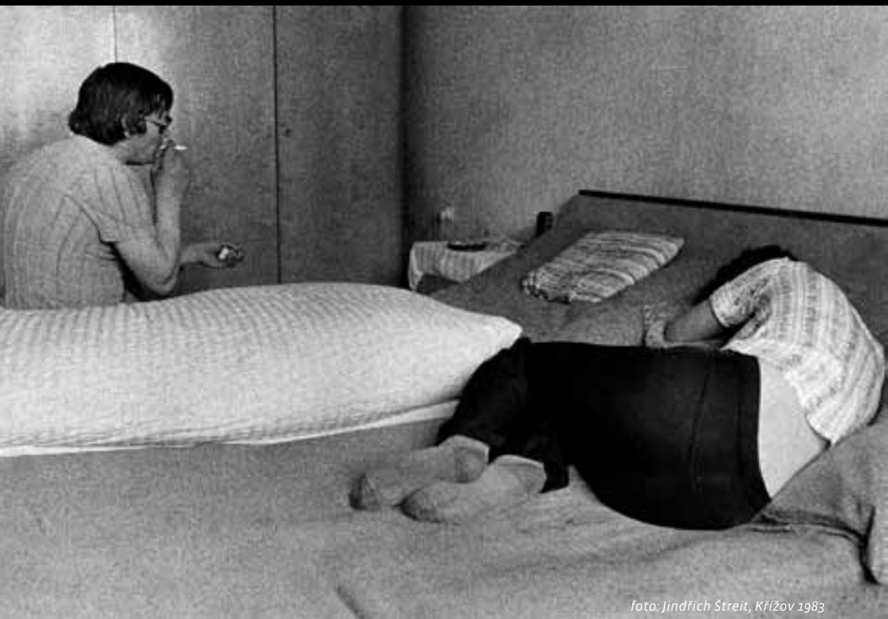
Křížov 1983