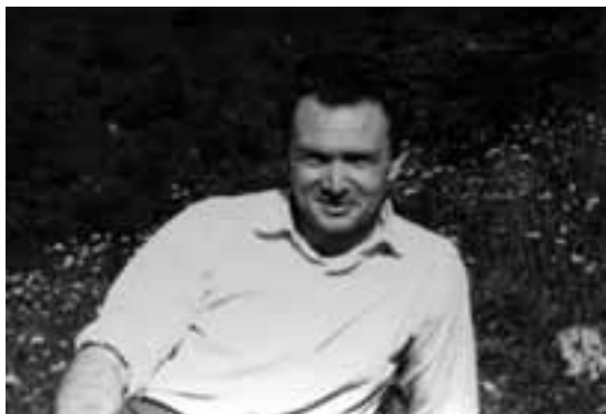
Před emigrací 1958