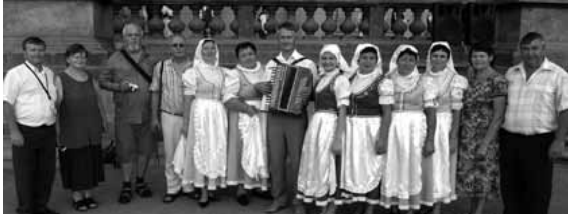
Bohemské frajerky v Praze

rozdívjet, a to jak na půdě sborové, tak i spolkové. Chci čtenáře informovat o tom, že se letos v týdnu od 24. do 30. září připravuje setkání krajanů pod názvem „Češi ve světě – oslavy Dne české státnosti 2012“, které se koná pod záštitou prezidenta republiky. Program je koordinován Ministerstvem zahraničních věcí ČR. Toto týdenní setkání bude zahrnovat slavnostní večer uspořádaný Národním muzeem v památníku na Vítkově, Mezinárodní krajaňský festival, konferenci Mezinárodního koordinačního výboru zahraničních Čechů, předání ceny „Významná česká žena ve světě“, přednášky v Náprstkově muzeu a celou akci zavřší slavnostní večer v Den české státnosti 28.