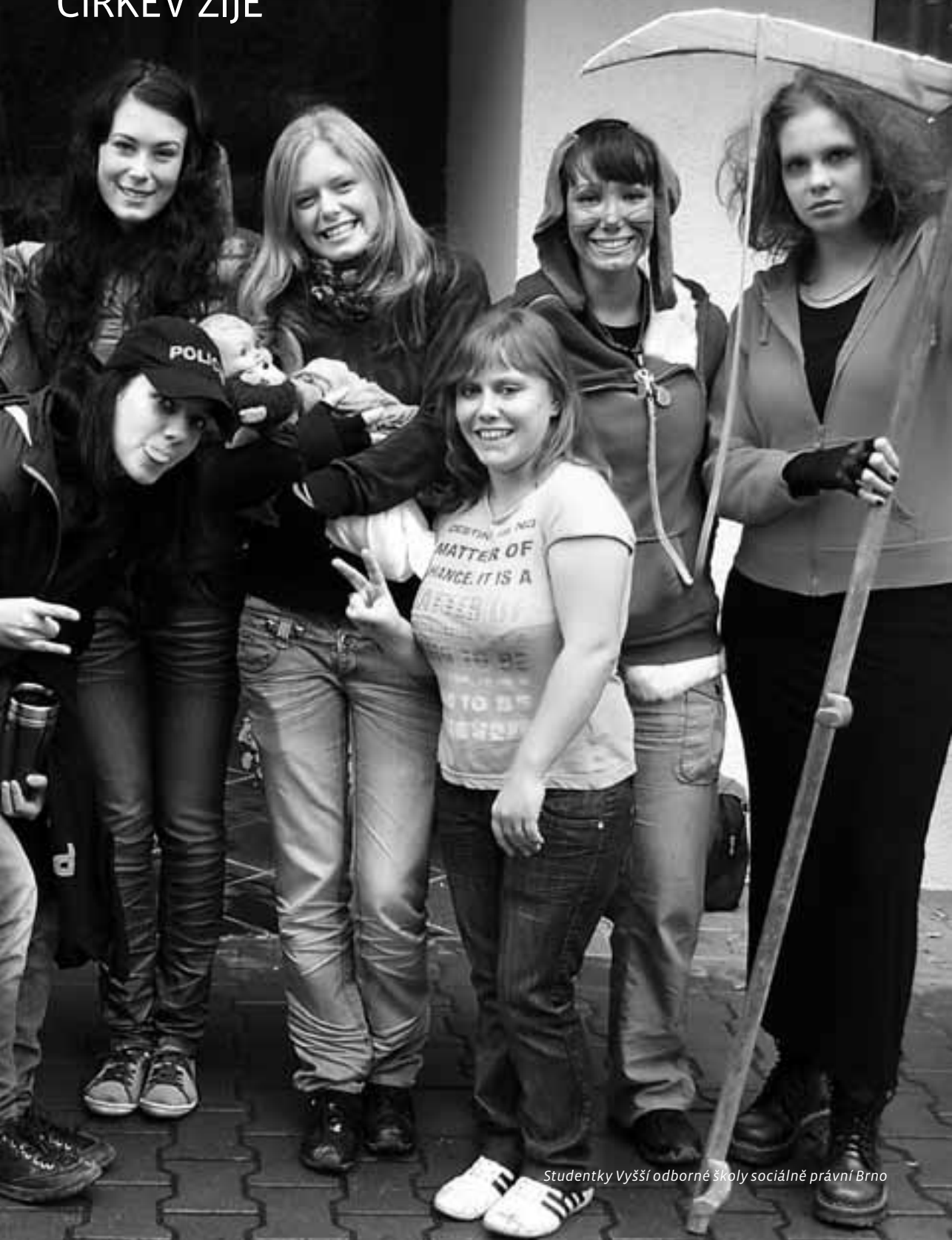
Studentky Vyšší odborné školy sociálně právní Brno