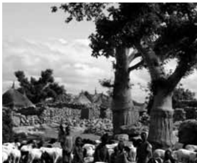
Pastevci ovčích stád, Idiely Na, Mali

Pro mě je to světadíl, kde tuším za současným tradičním životem a společenským neklidem hloubku historie; tisíciletí egyptského státu, řadu biblických dějů, oblast nejstarší křesťanské misie. Zároveň si jako varovné znamení připomínám vytlačení afrického křesťanství islámem ani sedm set let existence nějakého duchovního útvaru mu nezaručuje věčnost.