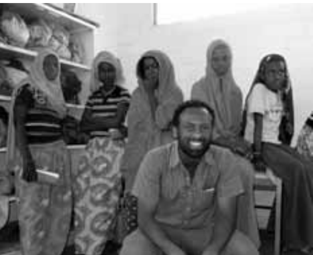
V dílně pro dívky, Bahir Dar, Etiopie

To je velmi různé. Projekty zadávané Českou rozvojovou agenturou v Praze se pohybují od necelého milionu až do prvních desítek milionů korun. Zastupitelské úřady mohou provádět tzv. malé projekty (cca do 400 tisíc Kč). Reálně je na rozvojovou spolupráci věnováno asi 0,1 % hrubého domácího produktu, což je podstatně méně, než k čemu se ČR zavázala. Toto nedostatečné financování však nesouvisí se škrtly za současného ministra financí. Je staršího data a je výrazem neochoty pomáhat, je to obyčejná chamtivost na státní úrovni, aby naše peníze zůstaly nám.