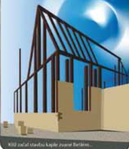
Kilš začal stavbu kaple zvané Betlém...