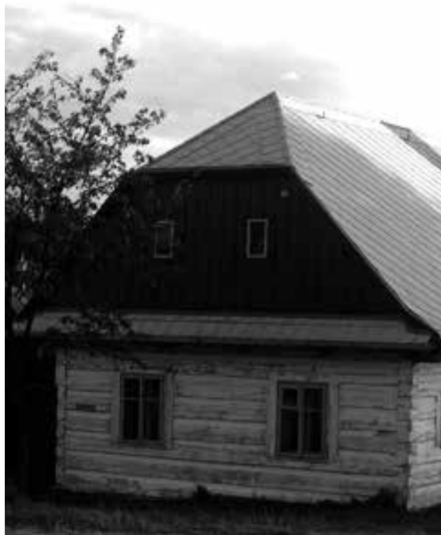
Evangelická škola v Proseči

chlapců 103, děvčat 64, celkem 167. Z těch chodilo pravidelně a pořádně 105, roztržitě 48, nikdy 14. Bylo protokolováno, že nedbalci byli politickému úřadu oznámeni, „načež potom sskolu giž nawsstěwowat neopomenuli“. Pilnost shledána jak „w náboženstwju tak w uměnj“