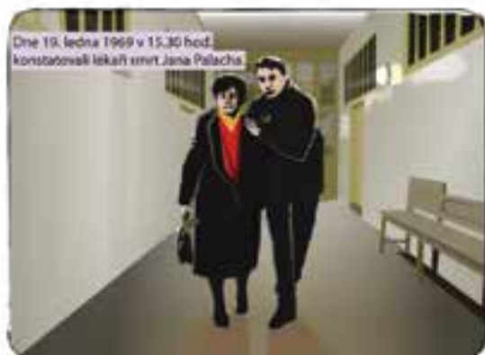
Dne 19. ledna 1969 v 15.30 hod. konstatovali lékaři smrt Jana Palacha.

text: www.janpalach.cz