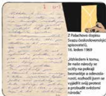
Z Palachova dopisu Svazu československých spisovatelů, 16. leden 1969