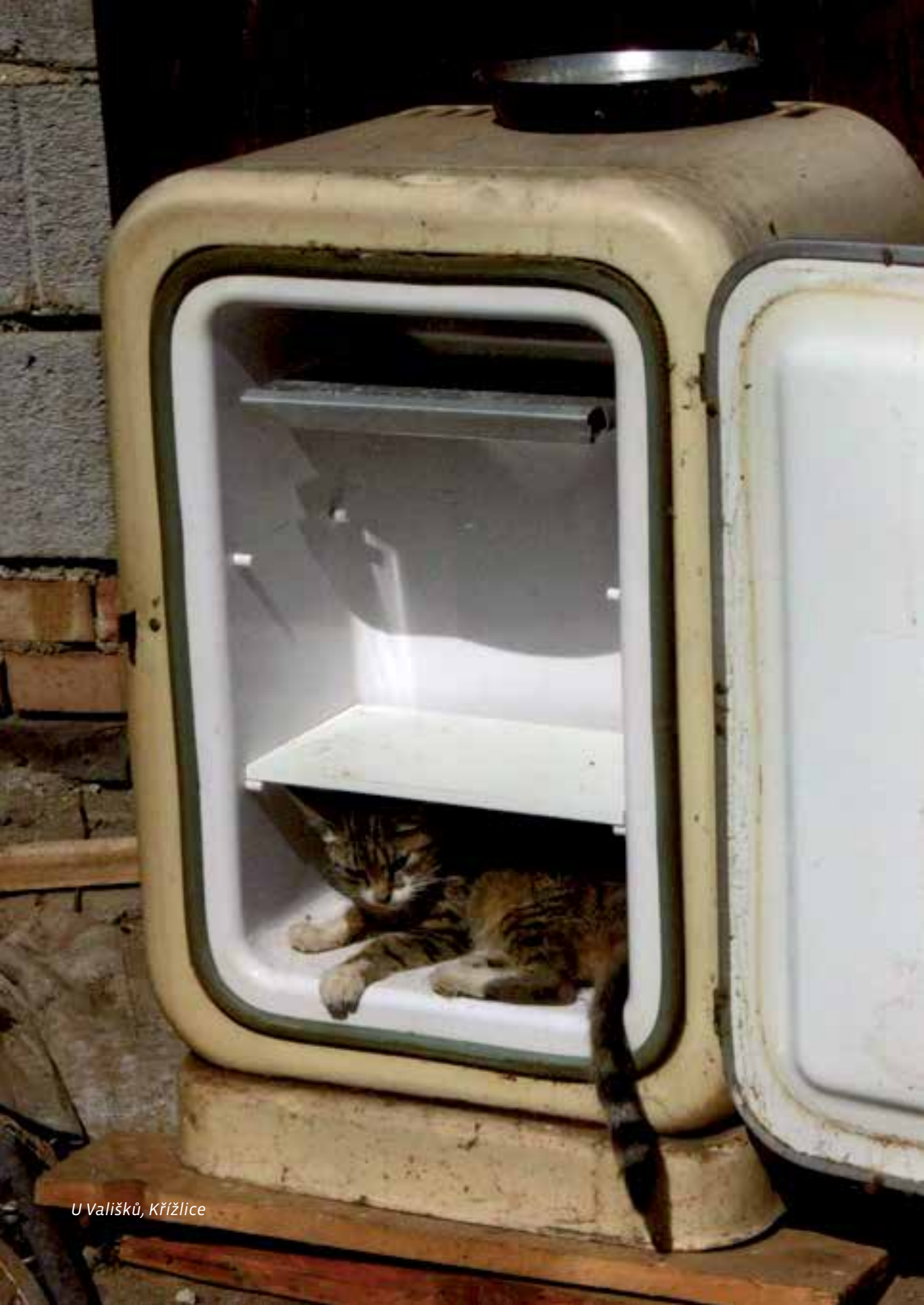
U Vališků, Křížlice