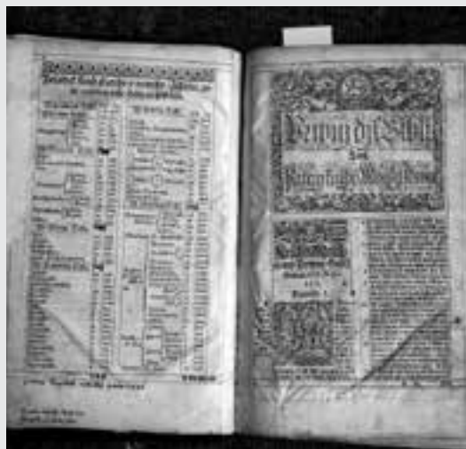
Bible kralická – Jednodílka z roku 1596

Udělejme si čas a vzdejme hold našim předkům, kteří v nelehkých podmínkách dokázali, že víra a lidská tvořivost dokážou zázraky. Oslavme důstojně mezník našich církevních a národních dějin. Vydejme se druhý zářijový víkend do Kralic nad Oslavou po stopách Bible kralické. Čeká nás bohatý kulturní program, který nám pomůže zařadit význam Bible kralické do širokého společenského a historického kontextu a také nám dokáže,