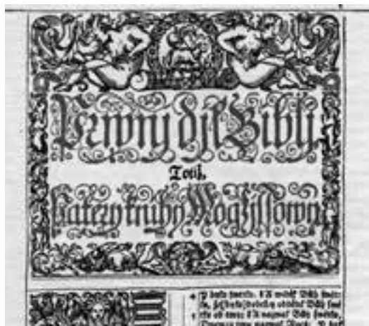
Vlys z 1. vydání Jednodílký (1596), uprostřed beránek s korouhví a andělci vrážející tyč do hadích tlam

drží v pravé ruce korouhev s praporem v podobě kříže (atribut vítězství), zatímco v levé ruce má na laně uvázané postavy smrti a ďábla. Vpředu ho předchází zástup, v jehož čele jde s harfou král David. Jedná se o antický motiv, který načerpal jeho tvůrce, grafik Václav Elam, jenž stojí také