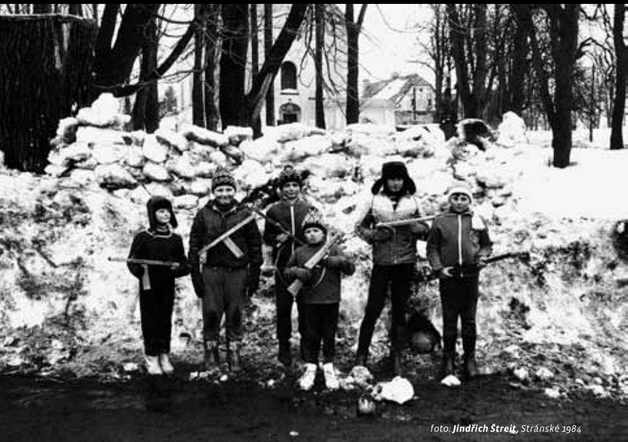
Stránské 1984