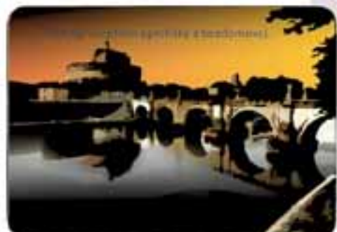
Řehořova opatření sponžily a bezpřívraty.

Řehoř ustavil v každém městě diakonský dům, kde byla rozdělována pomoc. Urozeným poslal jídlo z vlastní kuchyně, aby je neposílil závidlivci na diakonské službě.