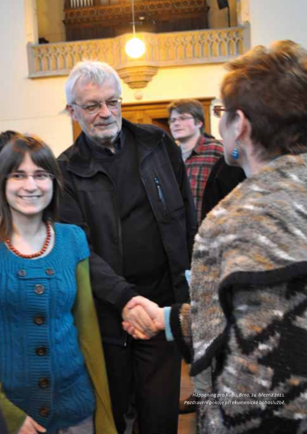
Happening pro Kubu, Brno, 24. března 2011. Pozdravení pokoje při ekumenické bohoslužbě.