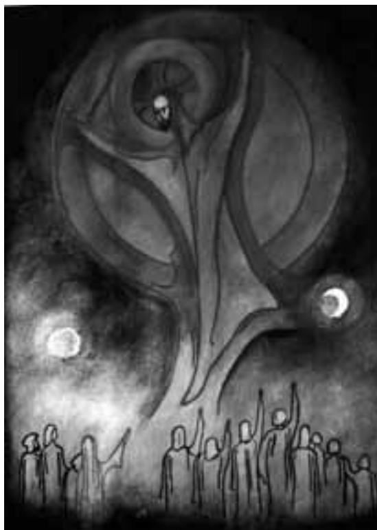
Joachim Suchhart: Nanebevstoupení Páně

po Velikonocích podle Sk 1,3), zatímco předtím bylo spojováno se sesláním Ducha. Tato spojitost je ale nesmírně poučná: namísto fyzické přítomnosti nastoupila duchovní přítomnost pro křesťanskou obec.