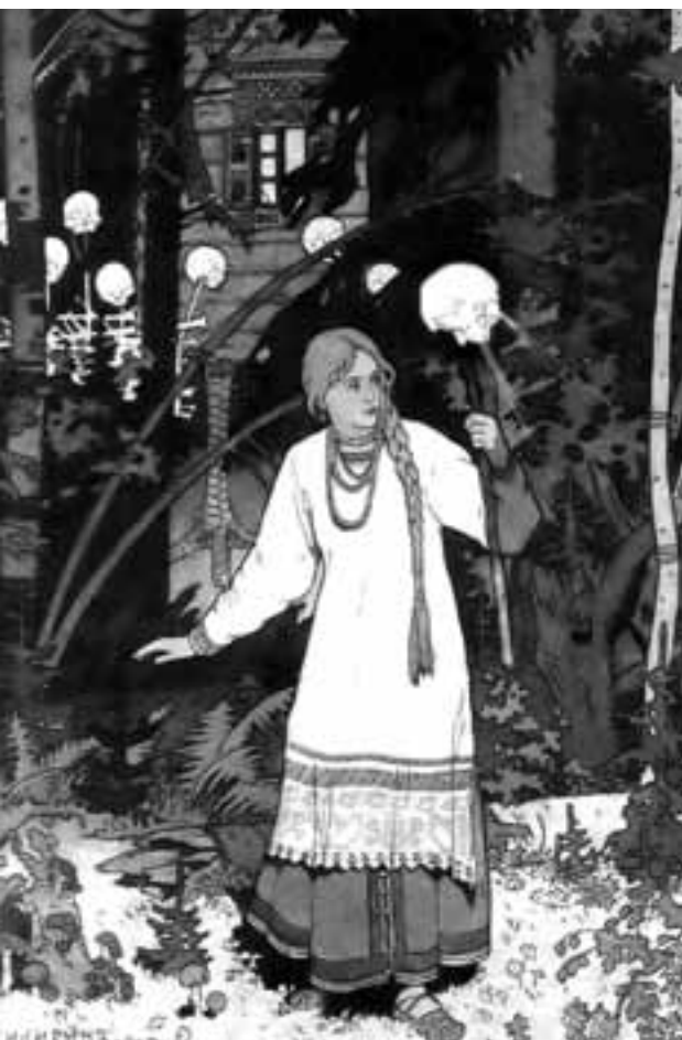
Vasilisa z ruských pohádek Krása nesmírná

Za přehnanou úzkostnost považují, když nám pohádky vadí kvůli kouzlům, kvůli magii. Už jen proto, že jistá kouzla s Boží pomocí konají i postavy Písma. Jákob očaruje březí kozy pomocí proutků ve žlabech, takže mu vrhají pruhovaná kůzlata. Mojžíš na Boží příkaz mění hůl v hada a hada zase v hůl. A až do nějaké třetí rány to,