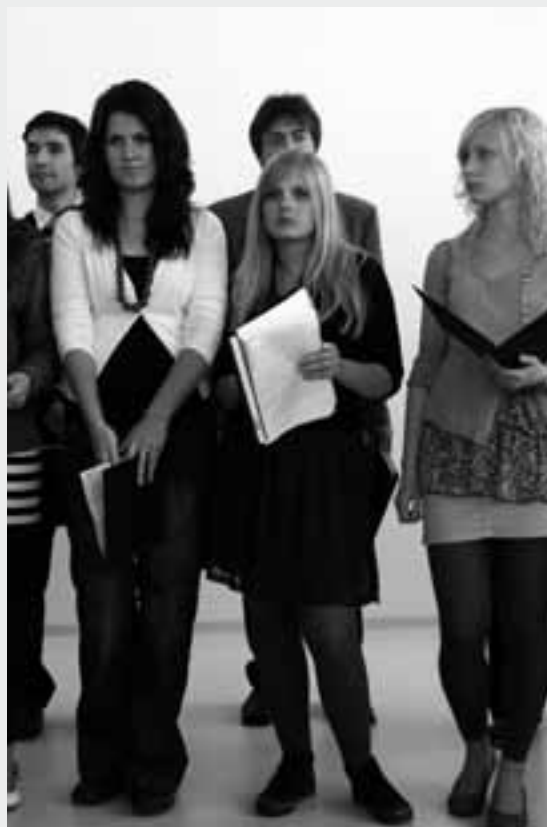
zpěváci z Chrudimi a Heřmanova Městce

V novém kostele půjčeném od místního sboru Církve bratrské, kde vše ještě vonělo novotou, se sjelo přes sto dvacet zpěváků a hudebníků, kteří naplnili prostor zpěvem a hudbou. Pořadí pěveckých sborů se losuje. Tak po sboru z Trnávky, který končil lidovou Prší prší, nastoupil příležitostný sbor z Pardubic, doprovázený houslistou, kytaristou a hobojistou konfirmačního věku. Pak zpívali místní, posílení zpěváky z Dolní Sloupnice, hostující Trutnov, pak Chrudimští spolu se zpěváky z Heřmanova Městce a nakonec početný sbor z Hradiště u Nasavrku. Předskokanem byl dětský pěvecký sbor z Hradiště, jehož členové se po vystoupení roztýlili zpět na klín svým rodičům nebo ven za vzduchem a hrou na trávníku.