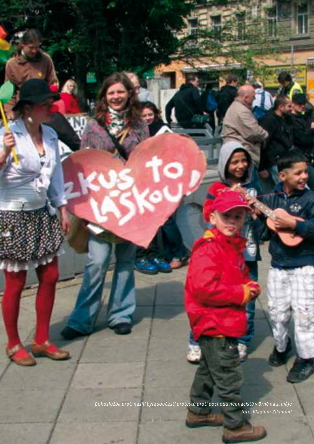
Bohoslužba proti násill byla součástí protestů proti pochodu neonacistů v Brně na 1. máje