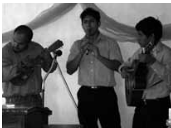
muzikanti při bohoslužbách v Tuxtle

V Pacayalu jde vývoj kupředu velmi zvolna. Přesto zde přibývá dětí, které chodí do školy, pomalu, velmi pomalu se zvyšuje hygienický standard, přibývá kontaktů se vzdálenou civilizací,